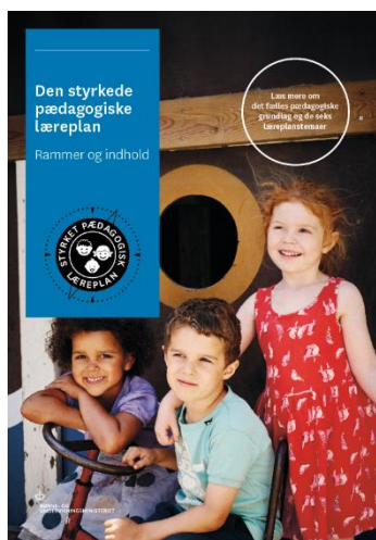
Den styrkede pædagogiske læreplan. Rammer og indhold

Denne skabelon indeholder alle de lovmæssige krav til evalueringen. Lovkravene finder I i de to midterste afsnit "Evaluering og dokumentation" og "Inddragelse af forældrebestyrelsen". Skabelonen indeholder desuden spørgsmål, som kan støtte jeres evalueringsproces samt jeres fremadrettede arbejde med løbende at revidere den skriftlige læreplan.